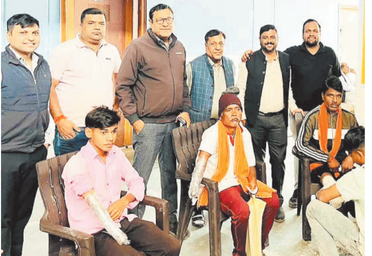
की जानकारी मिली तो वे शिविर में पहुंचकर निःशुल्क पैर व हाथ का माप देकर वहीं पर