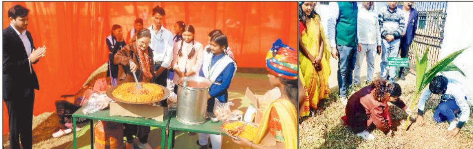
आनंद मेले में छात्राओं के साथ कलेक्टर।