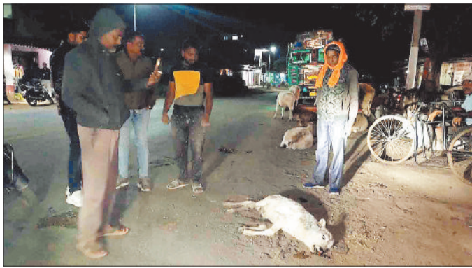
दुर्घटना में मृत मवेशी।