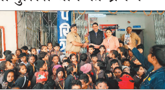
आनंद मेले में छात्राओं के साथ कलेक्टर।