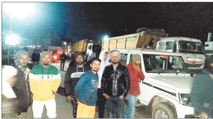
प्रदर्शन करते क्षेत्र के लोग।