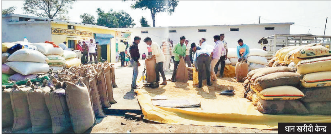
धान खरीदी केन्द्र

जिला विपणन कार्यालय से मिली जानकारी के अनुसार पटना उपार्जन केन्द्र में 14 टोकनों के जरिए 897.60 क्विंटल धान, गिरजापुर में 7 टोकनों से 355.60 क्विंटल धान, सोनहट में 8 टोकनों से 406.60 क्विंटल धान, खरीदी ▶ शेष पेज 4 पर